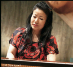
ピアノ:久元祐子 (国立音楽大学・大学院教授、ペーゼンドルフアー・アーティスト)